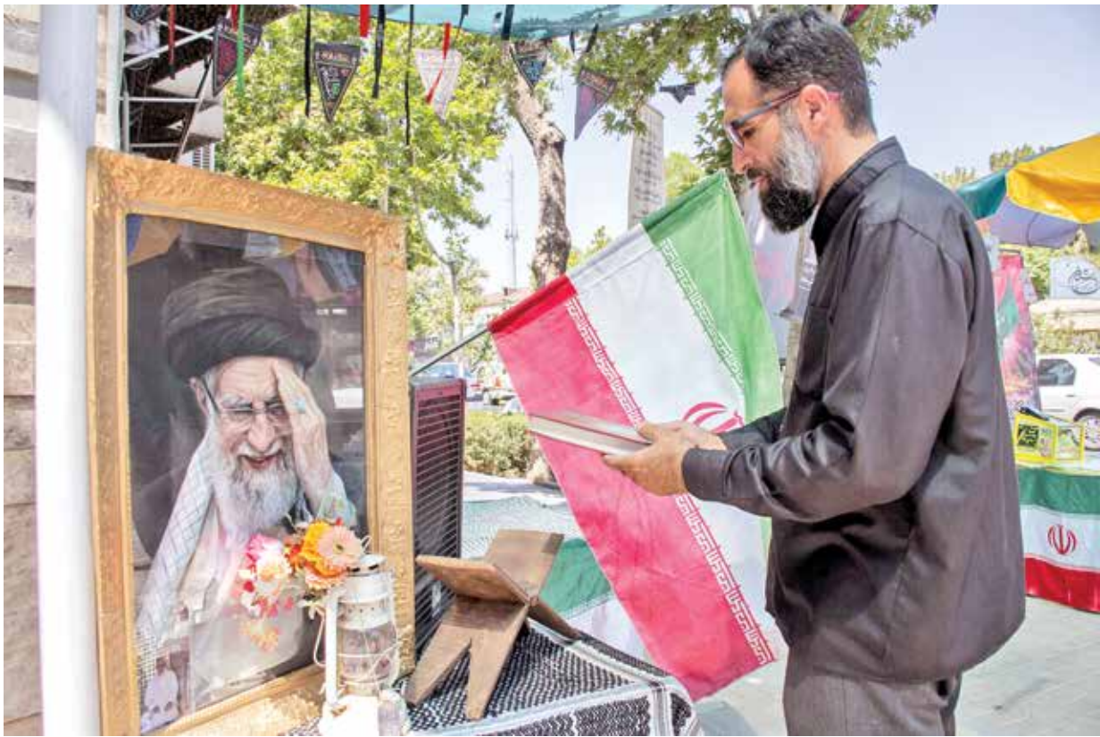
از خیابان امام رضا (ع) تا آستان خورشید؛ روایت شهری که برای وداع با فرزندش بیدار مانده است