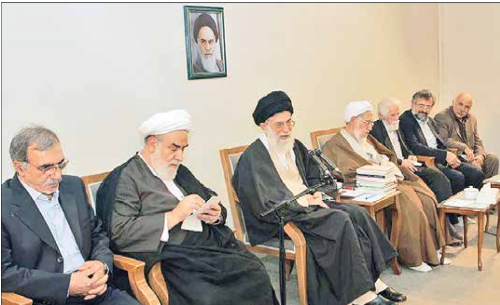
نمایی از دیدار شاعران و ادیبان با رهبر شهید در مرداد ۱۳۸۴

نگاه آقای شهید ایران به شعر، مناسبتی و فرمایشی نبود