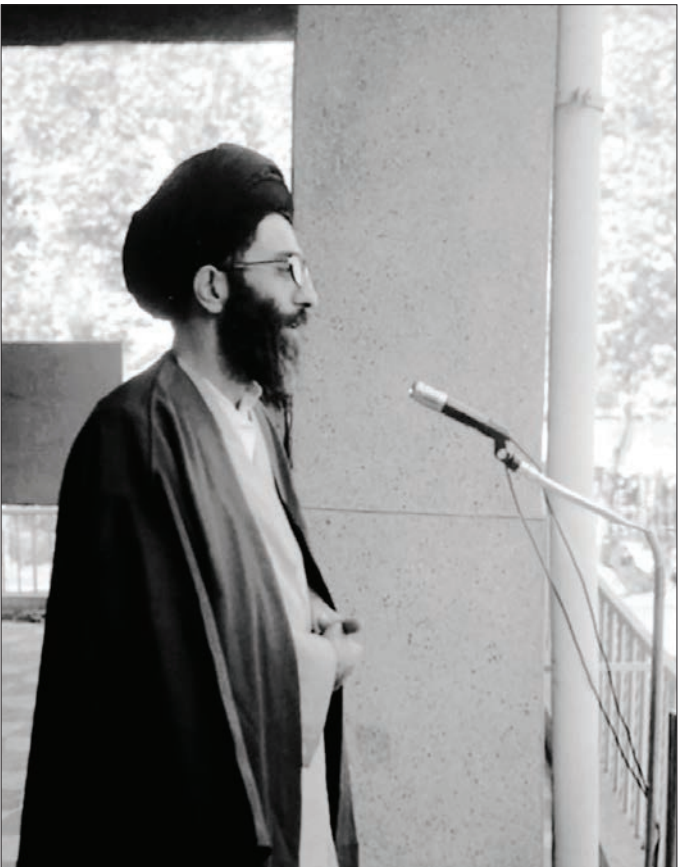
شهید آیت‌الله خامنه‌ای در حال سخنرانی در جمع محصلین بیمارستان امام رضا(ع) مشهد؛ آذر ۱۳۵۷

کتاب «خون دلی که لعل شد» شاید ده سال پس از «شرح اسم» منتشر شد. این کتاب همان خاطرات خودگفته آقای خامنه‌ای بود که در پرسش بالا به آن اشاره کردم. جایی که می‌دانم، البته شاید اشتباه کنم، بدم درز موضوع نمی‌توانستم به‌سرآه هر صاحب‌خاطره‌ای بروم، چرا که مؤسسه فرهنگی انقلاب اسلامی که متصدی ثبت و ضبط و تولید آثار مربوط به رهبر شهید بوده و هست، مسیر مشخصی برای انتشار چنین کتاب‌هایی تعریف کرده بود. ما از آن مسیر عبور نکردیم. دسته دوم، پرونده آیت‌الله خامنه‌ای در سازمان اطلاعات و امنیت کشور و دادرسی ارتش بود. ویژگی این دسته اسناد و مدارک آن بود که تولیدکننده‌شان، دستگاه حاکم بود؛ و از شخصی گزارش و خبر می‌گرفت که مقابل او بود و علیه او می‌کوشید؛ کسی را تعقیب می‌کرد که داشت ضد او فعالیت می‌کرد؛ از قبری بازجویی می‌کرد که او را دشمن می‌پنداشت. این دسته از مدارک یک‌دست و یک‌گونه نیستند. هم‌زیستی بیش از یک دهه با اسناد ساواک و سروکله زدن با انواع گزارش‌ها و خبرها تا حدود زیادی مرا در شناسایی و راستی‌آزمایی آنها آموخته کرده بود. این دانستم که خبرچین‌ها و منابع ساواک یک جور نیستند. کدام یک به سوژه نزدیک هستند؛ کدام یک دور. خبری که می‌گیرند بی‌واسطه است یا با واسطه؛ از این قبیل ملاحظات. کسانی که بخشی از عمرشان را با این سندها گذرانده‌اند می‌دانند که اعتماد کردن به آنها شرط و شروطی دارد. در این دسته از داده‌ها ما با بازجویی‌ها، شرح و محاکمات و دفاعیات آقای خامنه‌ای روبه‌رو هستیم. اینها برجسته‌ترین بخش از زندگی مبارزاتی او را از زبان دشمن بازگو می‌کنند.