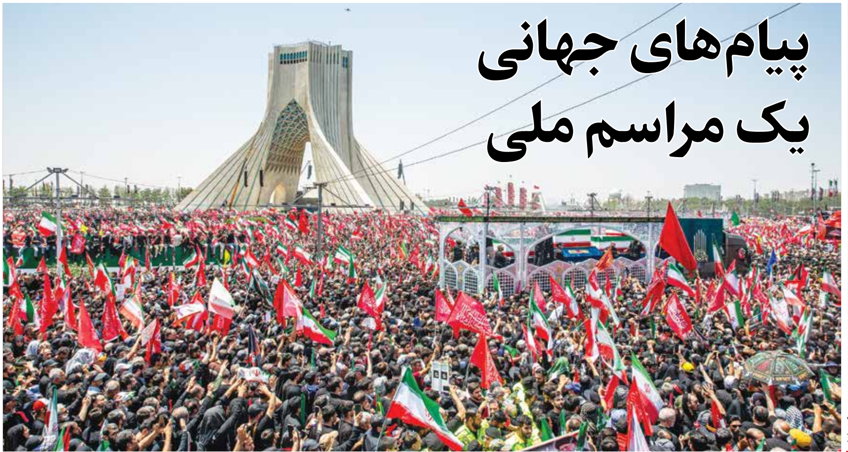
تیم ملی فوتبال ایران