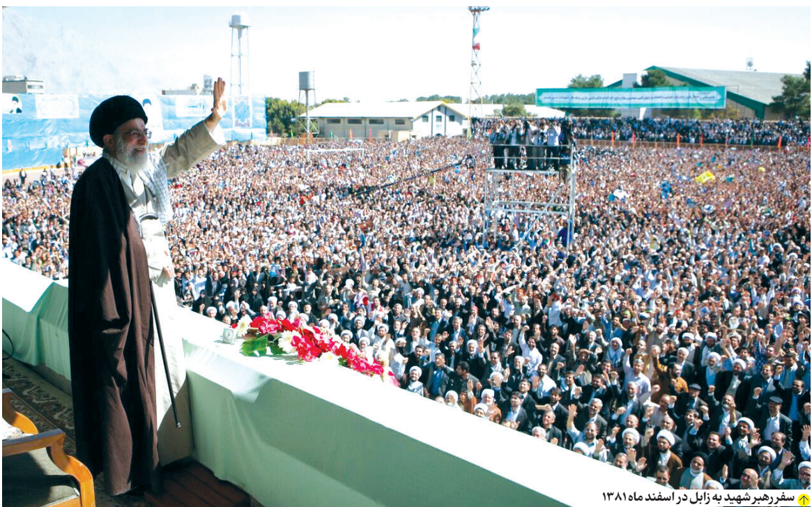
سفر رهبر شهید به زابل در اسفندماه ۱۳۸۱

از تپه نورالشهدای زاهدان، مقبره شهدای گمنام بازدید کرد ولی این نکته که ایشان از همه و حتی محافظانش سریع‌تر توانست به بالای تپه برسد در هیچ خبرگزاری رسمی ذکر نشده، اما در روایت امیرخانی به تفصیل آمده: «تپه نورالشهدا شیب زیادی دارد. تقریباً مثل قسمت آخر شیرپلا. البته راه‌پله‌ای را در مسیری پهن‌پایب با سنگ ساخته‌اند که کار صعود را آسان‌تر می‌کند. اما همه درمناذایم در رهبر آیم می‌تواند این تکه را بالا بیاورد یا نه... آقا یک نگاه می‌اندازد به بالای تپه و مقبره و گل از گلش می‌شکفت. سردار حفاظت، با دست مسپیر و پله‌ها