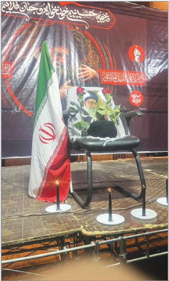
پانزده تیر ۱۳۹۰