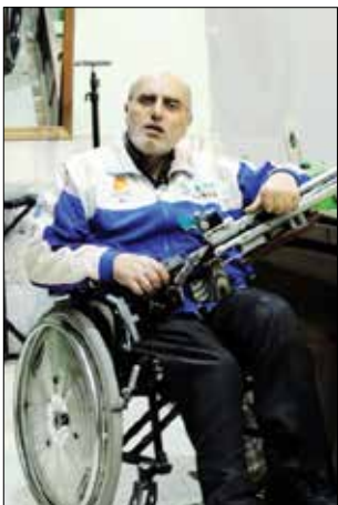
جانباز همیشه تسلط خوبی بر سلاح خود دارند و هدف را به خوبی می‌زنند.

چندین طبقه زیرزمین زندگی می‌کند. دشمنان کشور عزیز ایران همواره در پی غارت و چپاول اموال و دارایی‌های ما هستند و برای این کار، همواره بهانه‌ای طراحی کرده و آن را با تبلیغات گسترده مطرح می‌کنند و سپس به آن کشور حمله کرده و ثروت آن را به یغما می‌برند. این جانباز دفاع مقدس از خاطرات دیدارش با رهبر شهید نیز می‌گوید: «به یاد دارم سال ۱۳۷۲، پس از کسب مدال طلای مسابقات جهانی انگلستان، به دیدار ایشان رفتم که رهبر شهید پس از مشاهده سیل‌های تیراندازی من فرمودند که ورزشکاران