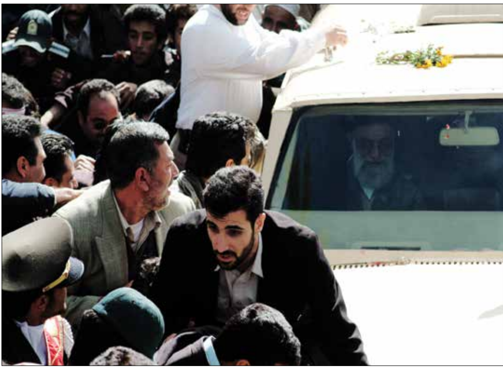
استقبال پرشور مردم سیستان و بلوچستان از رهبر شهید انقلاب در اسفند ۱۳۸۱

مردمی بوده در آن روزهای سخت در وصف رشادت مردم ایران نوشت: «زمان در ایران زیاد دست به دست شده اما زمین هرگز دست به دست نشده و در این روزهای سخت، قدرت مردمی بالاتر از قدرت سیاسی و... است. آرزوی منم مردم کشور سربریند، پایدار و تندرست باشند.» اما ۹ آذر ۱۴۰۴ رضا امیرخانی در پرواز با پاراگلایدر سقوط کرد و ۷ ماه است که در خوابی عمیق فرو رفته و از هیاهوی روزگار بی‌خبر است. امیرخانی اگر هوشیار و سرپا بود، این روزها پیش از گذشته به روایتش نیاز داشتیم. هم روایتش از ایران و هم روایتش از زیادی‌دریابه شخصیت فرهنگی و خصائل اخلاقی اش داشت. حالا که امیرخانی نمی‌تواند احوال این شهادت و رشادت پس از جنگ رمضان را روایت کند، روایت ۲۳ سال پیش او از همراهی با رهبر شهید در سفر به استان سیستان و بلوچستان را مرور می‌کنیم.