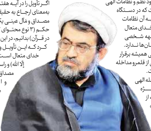
پسندیده‌ی خداوند است و در صورت مستقیم و در لحظه که بسا از نگاه ما استثنائی و برخلاف قواعد مقرر باشد، اما آنها نیز تماماً در چارچوب نوظلمات الهی هستند، لیکن وجود نظم و نظامات الهی به این معنا نیست که در دستگاه الهی، همه چیز به آن نظامات ارجاع می‌شود و خدای متعال به شخصه، مواجهه شخصی با پدیده‌ها و انسان‌ها ندارد.

تدبیر الهی همواره برقرار است و هیچ اتفاقی از قلمرو مداخله‌ی خارج نیست؛ اما فهم اینکه چرا و چگونه امداد غیبی یا مداخله‌ی ویژه رخ داده، فراتر از دایره‌ی شتاب‌زده و تفسیرهای عامیانه‌ی پیروزی و شکست است