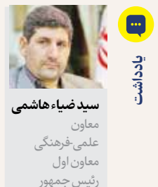
سید ضیاء هاشمی معاون علمی فرهنگی معاون اول رئیس‌جمهور

با توجه به وسعت جغرافیایی مبادی سفر و جمعیت مشتاقان، مراسم وداع و تشییع رهبر شهید، طی یک برنامه چندمرحله‌ای در سه شهر کلیدی ایران (تهران، قم و مشهد مقدس) و دو پایتخت معنوی جهان تشییع در کشور عراق (کربلا و نجف) انجام می‌شود. این انتخاب سه‌گانه و دو شهر مذهبی، به ترتیب بازتاب‌دهنده چند رکن اساسی نظام است: پایتخت سیاسی و اداری (تهران)، مرکز فقه و مرجعیت (قم)، مرجعیت نظام تشیع (نجف و کربلا) و قطب معنویت و ولایت (مشهد). این رویداد تاریخی از چنان عظمتی برخوردار است که ایجاب می‌کند ابعاد و زوایای آن به طور ویژه مورد توجه قرار گیرد و معانی نهفته در هر بخش آن توضیح داده شود.