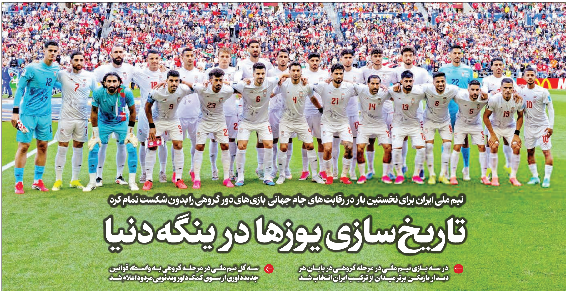
تیم ملی ایران برای نخستین بار در رقابت های جام جهانی بازی های دور گروهی را بدون شکست تمام کرد