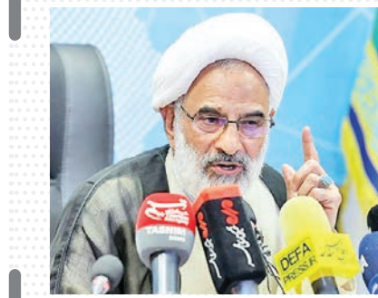
نماینده ولی فقیه در سپاه: