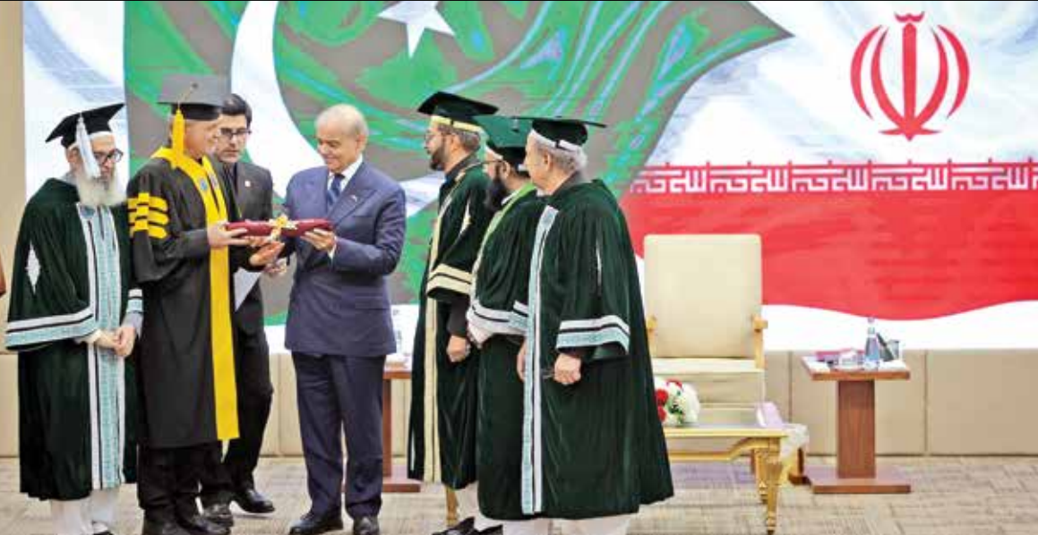
مراسم اعطای دکترای افتخاری جراحی قلب به پزشکان در پاکستان

پزشکیان با اشاره به تجربه‌های خود در سال‌های گذشته درباره مسائل این منطقه، اظهار کرد که برای دستیابی به توسعه پایدار باید مشخص شود منابع آبی موجود چه میزان پاسخگوی نیازهای منطقه هستند و توسعه بخش‌هایی مانند صنعت، کشاورزی و دامداری بر چه مبنایی انجام می‌شود. به گفته وی، هرگونه تصمیم برای ایجاد صنایع یا توسعه فعالیت‌های اقتصادی باید با نظر گرفتن تأثیر آن بر آینده منابع طبیعی و زندگی مردم اتخاذ شود. رئیس‌جمهوری یکی از مشکلات اساسی مدیریت منابع را نبود اطلاعات دقیق و برنامه‌ریزی مدیعت دانست و گفت در گذشته هنگام بررسی وضعیت منطقه، آمار قابل اتکایی درباره میزان منابع آب، تعداد دام، ظرفیت مراتع و برنامه‌های توسعه‌ای