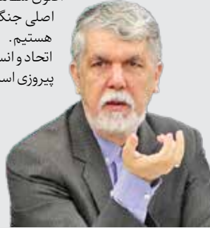
سیدعباس صالحی وزیر فرهنگ و ارشاد اسلامی در صفحه شخصی خود در یکی از شبکه‌های اجتماعی

اتحاد و انسجام ملت ایران، رمزگشای این پیروزی است. نگاهبان آن باشیم.