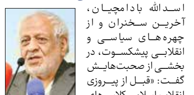
اسدالله بادامچیان، آخرین سخنران و از چهره‌های سیاسی و انقلابی پیشکسوت، در صحبت‌هایش گفت: «قبیل از پیروزی انقلاب اسلامی کلاس‌های آموزش عربی را به روشی