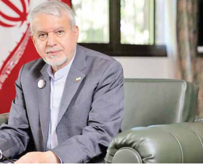
حسن روحانی، رئیس‌جمهور ایران در دیدار با وزیر میراث فرهنگی، گردشگری و صنایع دستی ایران

دنیال می‌کنند. برای نمونه، زمانی که تیم ملی فوتبال ایران به جام جهانی صعود می‌کند، خیابان‌های ایران مملو از جوانان می‌شود. همین حالا نیز میلیون‌ها ایرانی مسابقات جام جهانی فوتبال را از طریق تلویزیون دنبال می‌کنند. اما در کنار این، خیر تاختی نیز وجود دارد. دشمنان حتی مراکز ورزشی ما و ورزشگاه‌ها را هدف قرار دادند. در یک حمله به یک مرکز ورزشی در شهر لامرد، بیش از ۴۰ نفر که در آنجا حضور داشتند به شهادت رسیدند که بیشتر آنان دختران جوانی بودند که در یک رقابت والیبال شرکت داشتند. در تهران نیز ورزشگاه آزادی هدف قرار گرفت و یک سالن ۱۲ هزار نفری به‌طور کامل تخریب شد. دشمنان ما هیچ‌گونه پایبندی به قوانین بین‌المللی ندارند. من از شما به‌عنوان نماینده یک رسانه مهم می‌خواهم این سؤال را با افکار عمومی اسپانیا مطرح کنید: ورزشگاه‌های ما، جوانان ما و نوجوانان ما چه گناهی داشتند که هدف جنایت قرار گرفتند و بمباران شدند؟ (وزیر در طول گفت‌وگو نشان سینه‌ای بر لباس خود دارد که عدد ۱۶۸ و تصویر ای یک کوله‌پشتی خون‌آلود را نشان می‌دهد؛ نمادی نیز بازدید کنیم. ما حتی کلیسای سنت استپانوس را نیز در فهرست آثار ثبت‌شده در یونسکو به ثبت رسانده‌ایم.