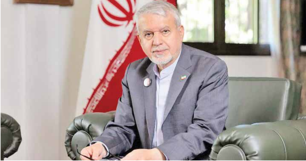
حسن روحانی، رئیس‌جمهور ایران در دیدار با وزیر میراث فرهنگی، گردشگری و صنایع دستی ایران

در ایران را فراهم کند تا ظرفیت‌های تمدنی، فرهنگی و گردشگری دو کشور بیش از پیش به‌افکار عمومی معرفی شود. وی همچنین از وزیر هنر، گردشگری، فرهنگ و اقتصاد و نیجریه، با قدردانی از نگاه مثبت جمهوری