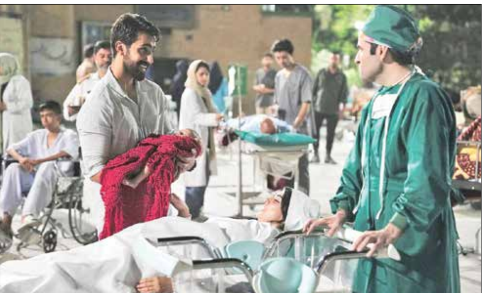
نمایی از فیلم «نیم‌شب» به کارگردانی محمدحسین مهدویان

شاید مهم‌ترین وظیفه فیلمسازان امروز آن باشد که نشان دهند مفهوم دفاع، ابزار و مقاومت همچنان پابرجاست، اما شکل ظهور آن تغییر کرده است. همان‌طور که نسل دهه شصت روایت خود را داشت، نسل امروز نیز نیازمند روایت‌های تازه‌ای است که از دل جهان پیچیده و چندلایه معاصر بیرون آمده باشند. آینده سینمای دفاع مقدس مرکزی روایت در فیلم‌ها باشد. این تنوع به سینمای دفاع مقدس امکان می‌دهد دامنه مخاطبان خود را گسترش دهد و از تکرار الگوهای آشنا فاصله بگیرد.