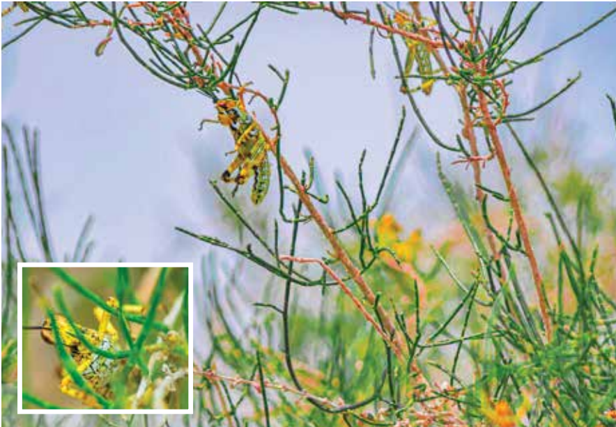
طغیان ملخ در مزارع خراسان

مدت‌ها قبل قابل پیش‌بینی بود، می‌گوید: «از مهرماه سال گذشته و در جریان پایش‌های سالانه، همکاران ما با تراکم بالای کیسول‌های تخم ملخ در ارتفاعات و کانون‌های مختلف استان مواجه شدند.