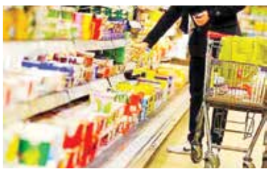
«ایران» ابعاد مختلف دیده مصرف‌گرایی را بررسی می‌کند