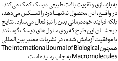
دیسک‌سوزهای خارجی تنها نقش یک پرتوی جابجایی‌کننده فیزیکی را ایفا می‌کنند، سامانه بومی محققان امیرکبیر فراتر عمل کرده و با تحریک ترشح «گلیکوآمینوگلیکان»، به بازسازی و تقویت بافت طبیعی دیسک کمک می‌کنند. در واقع، این محصول تنها تهداد در آن تسکین می‌دهد، بلکه فرآیند خوددرمانی بدن را نیز فعال می‌سازد. نتایج درخشان این طرح که روی سلول‌های دیسک گوسفند موفقیت آزمایشی شده، در نشریات معتبر بین‌المللی همچون The International Journal of Biological Macromolecules به چاپ رسیده است.

مطالعه جدیدی که نتایج آن در نشریه تحقیقات ژئوفیزیک منتشر شده و به گفته «پاولو پیرم»، دانشمند علوم سیاره‌ای در آزمایشگاه فیزیک کاربردی دانشگاه جانز هاپکینز، فرضیه برخورد یک جرم آسمانی شبیه دنباله‌دار را با عطارد تقویت می‌کند. بر اساس این سناریو، جرمی یخی با قطر حدود ۱۷ کیلومتر با سرعتی نزدیک به ۳۰ کیلومتر بر ثانیه، با سطح سیاره برخورد کرده است. زمین‌شناختی و شیمیایی عطارد، همخوانی دارد.