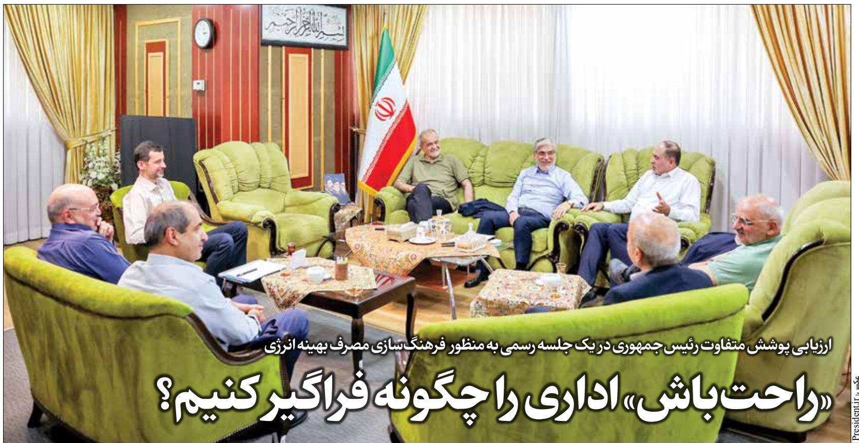
ارزیابی پوشش متفاوت رئیس جمهوری در یک جلسه رسمی به منظور فرهنگ سازی مصرف بهینه انرژی