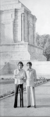
درویش‌رضا منظمی در کنار استاد شجریان در دوران جوانی

دیروز استاد درویش‌رضا منظمی در ۸۷ سالگی چشم از جهان فروبسته است، جامعه موسیقی ایران یکی از چهره‌های ارزشمند خود را از دست داده است؛ هنرمندی که از الستر برخاست، با بزرگان موسیقی ایران هم‌نفس شد، در شکل‌گیری یکی از مهم‌ترین جریان‌های موسیقی معاصر نقش داشت و تا واپسین سال‌های عمر، وفادارانه در کنار عشق اولین خود ایستاد.