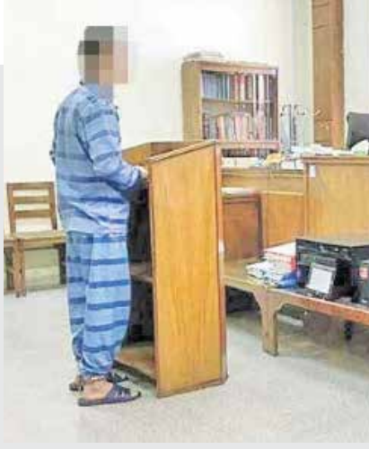
با تکمیل تحقیقات، پرونده برای رسیدگی به دادگاه کیفری یک استان تهران فرستاده شد.

در حالی که ۵ سال از ماجرا گذشته بود، پلیس مرزبانی خبر داد که یکی از متهمان در مرز ایران و ترکیه خودش را تسلیم کرده و بازداشت شده است. به این ترتیب با انتقال متهم به تهران، وی تحت بازجویی قرار گرفت و مدعی شد در دفاع از خودش مرتکب قتل شده است.