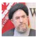
سیدمحمدرضا میر تاج‌الدینی نماینده ادوار مجلس