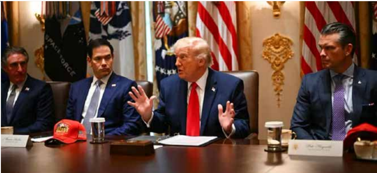
تحلیل لوموند درباره تهدید عمان توسط ترامپ؛ چرا واشنگتن درباره هماهنگی تهران-مسقط نگران است؟