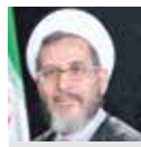
احمد مانعی نماینده سابق مجلس و فعال سیاسی