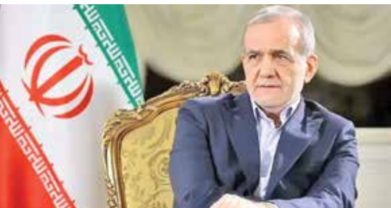
فرارسیدن عید سعید قربان به دولت

فرارسیدن عید سعید قربان به دولت تلفنی، با تبادل تریبکات صمیمانه به مناسبت فرارسیدن عید سعید قربان، بر لزوم تقویت پیوندهای برادرانه و توسعه همکاری‌های همه‌جانبه میان دو کشور همسایه تأکید کردند. رؤسای جمهوری ایران در گفت‌وگو، درباره روند همکاری‌های دوجانبه در حوزه‌های کلان اقتصادی، ترانزیتی و تعاملات مردمی تبادل نظر کرده و بر ضرورت تسریع در اجرای توافقات فیما بین جهت ارتقای سطح مناسبات تأکید کردند. در این تماس تلفنی، پزشکبان با تبریک فرارسیدن روز ملی و سالگرد استقلال جمهوری آذربایجان به دولت و ملت این کشور، از مواضع سازنده و حمایت‌های باک در جریان تحولات اخیر قدرتی و ابراز امیدواری کرد که صلح، پیشرفت و امنیت پایدار در سایه تعاملات منطقه‌ای تقویت شود.