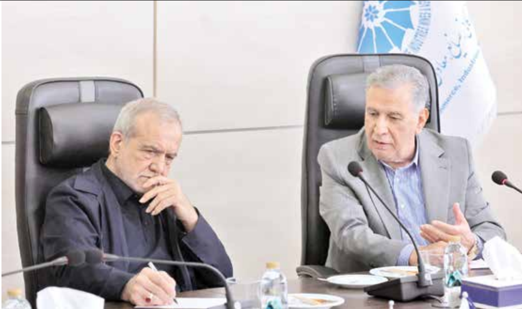
روایت فعالان بخش خصوصی از نشست اخیر با رئیس جمهوری در گفت‌وگو با «ایران»