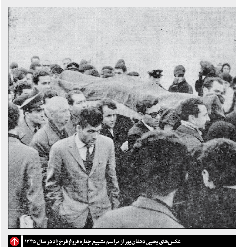
عکس‌های یحیی دهقان پور از مراسم تشییع جنازه فروغ فرخ‌زاد در سال ۱۳۴۵

در سفرهای عکاسی دوربین بردست از چیزهایی عکس می‌گرفت که هیچ‌وقت نمی‌شد حدس زد نتیجه نهایی چیست. چون گاهی به قول مهران مهاجر «تکه تکه گی» و تبدیل به کلزهایش می‌شدند یا چنان بی‌رحمانه کادر را می‌بست که باورش برای یک عکاس معمولی سخت بود که منظور می‌شود چنین موضوعی را عکس نامید.