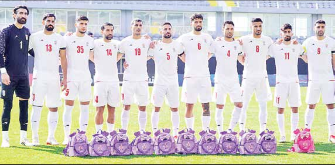
کسب و کارهای ورزشی هم باید نقش داشته باشند؟

آیا می‌توان ورزش را فضایی برای ارتباط بین طبقات مختلف اجتماعی دانست؟ ورزش یکی از معدود فضاهایی است که افراد از طبقات مختلف اجتماعی می‌توانند در کنار هم قرار بگیرند و تجربه مشترکی داشته باشند؛ مثلاً همه با هم یک تیم را تشویق کنند. در جامعه‌شناسی به این نوع فضا «فضای سوم» گفته می‌شود. پژوهش‌ها، به‌ویژه در مسابقات واقعی چالش‌های اجتماعی بوده‌اند، نشان می‌دهد که ورزش می‌تواند به گفت‌وگو و همکاری میان گروه‌های مختلف کمک کند. البته اگر ورزش حرفه‌ای کاملاً در اختیار ثروتمندان قرار بگیرد، این کارکرد مثبت تضعیف می‌شود و حتی می‌تواند به بازتولید نابرابری‌ها منجر شود. برای جلوگیری از این وضعیت، باید سیاست‌هایی مثل ارزان‌سازی بلیت برای اقدشار کم‌درآمد و جلوگیری از تبعیض در آکادمی‌های ورزشی اجرا شود.