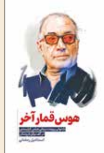
چهل روز پس از هاشمی