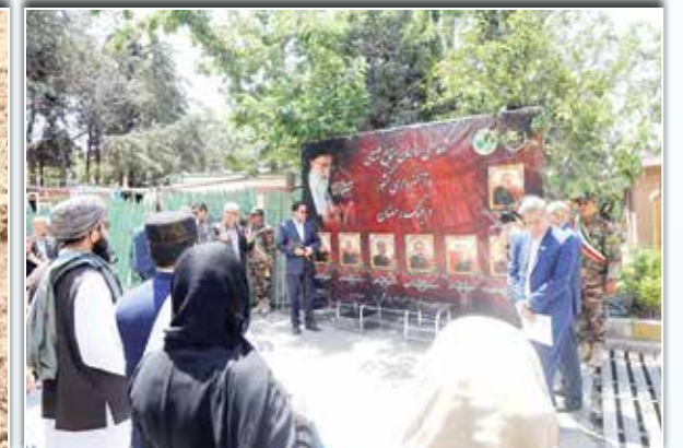
سفرای بیش از ده کشور جهان در ایران، از جمله اندونزی، عمان، پاکستان، سریلانکا، افغانستان، ژاپن و اوگاندا و همچنین رؤسای سازمان‌های یونسکو، فاو و برنامه عمران ملل متحد در ایران، از سازمان منابع طبیعی و آبخیزداری کشور بازدید کردند. در این برنامه، به یاد شهدای جنگ تحمیلی سوم از جمله شهدای منابع طبیعی و دانش‌آموزان میناب درخت کاشته شد