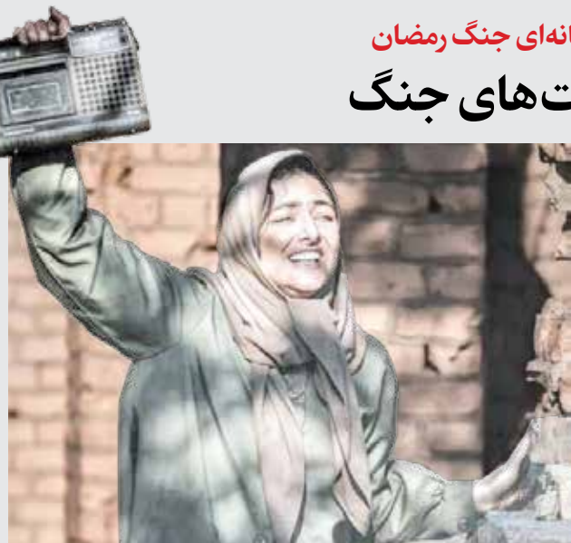
شرح عکس: نمایی از فیلم آبادان یازده ۶۰

جنگ تحمیلی سوم با «جنگ رمضان» فارغ از سوبه‌های سیاسی - نظامی خود، از منظر جامعه‌شناختی جنگ دست‌کم واجد دو ویژگی عمده بود: جنگ شهری و جدال رسانه‌ای. شاید همین دو ویژگی است که آن را از ساختار و مدل جنگ هشت ساله تحمیلی متمایز می‌کند و همین تمایز ایجاد می‌کند تا سینمای ایران که به واسطه جنگ هشت ساله، شاهد تولد ژانر دفاع مقدس بوده حالا با تصاویر، تفاسیر و روایت‌های تازه‌ای در این ژانر براساس تجربه جنگ اخیر دست بزند. قطعاً فیلم‌هایی که بعد از این در سینمای جنگ یا ژانر دفاع مقدس تولید خواهد شد نمی‌تواند به دو سوبه شهری و رسانه‌ای بودن آن بی‌توجه باشد.