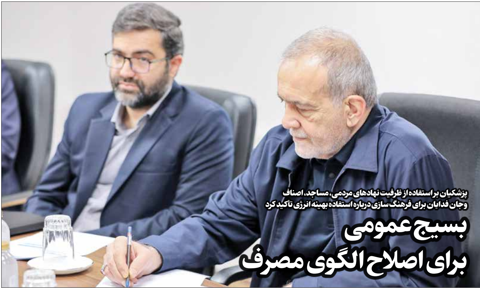
پزشکیان بر استفاده از ظرفیت نهادهای مردمی، مساجد، اصناف و جان فدایان برای فرهنگ سازی درباره استفاده بیپینه انرژی تاکید کرد