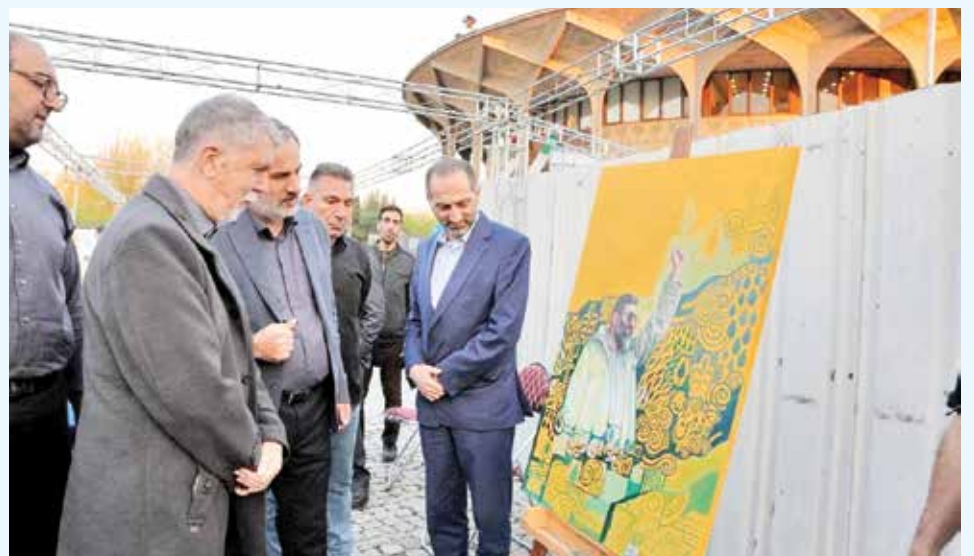
شرح عکس: بازدید وزیر فرهنگ و ارشاد اسلامی در ویژه برنامه فرهنگی هنری «برای ایران، سرچشمه هنر»