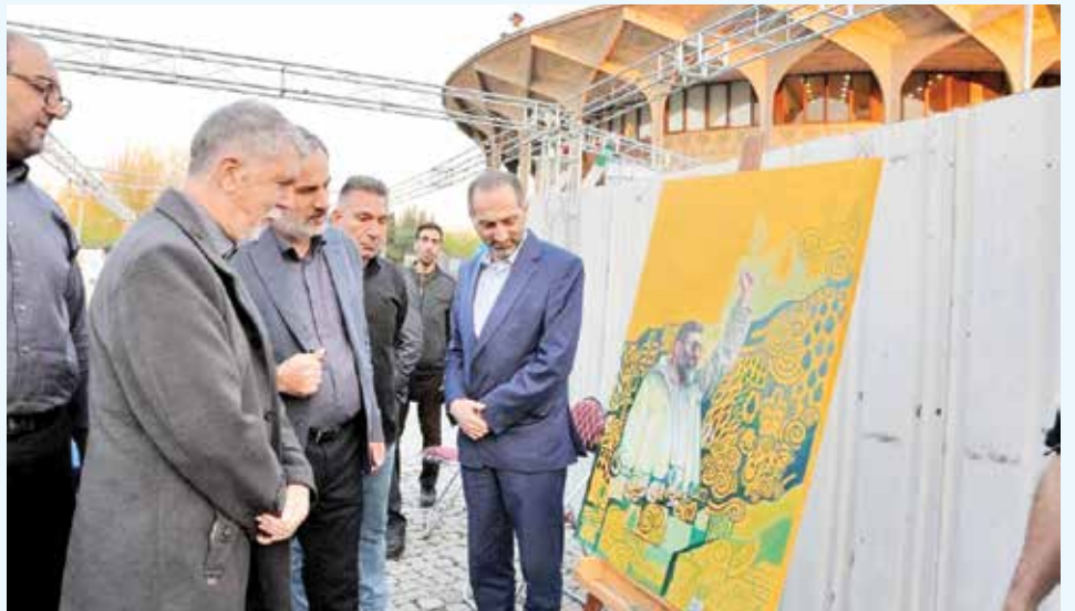
شرح عکس: بازدید وزیر فرهنگ و ارشاد اسلامی در ویژه برنامه فرهنگی هنری «برای ایران، سرچشمه هنر»

ملی آغاز کنند تا از واگرایبی قومیتی و مذهبی جلوگیری شود.»