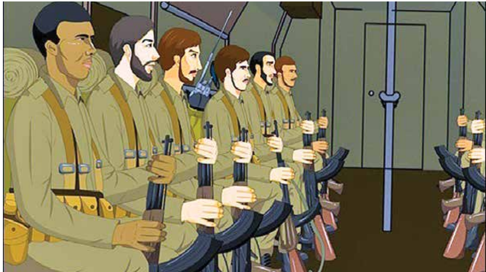
شرح عکس: نمایش از انیمیشن ایرانی شهردار در تهران جامه