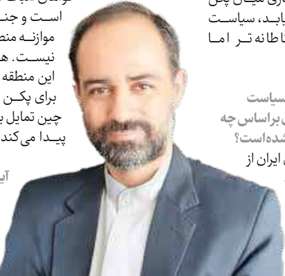
آیا چین می تواند از نفوذ اقتصادی و سیاسی خود برای کاهش تنش میان ایران و

رقابت چین و آمریکا امروزه به یکی از متغیرهای اصلی تحولات خاورمیانه تبدیل شده است. بحران های منطقه ای دیگر صرفاً در سطح بازیگران محلی قابل تحلیل نیستند، بلکه بخشی از فرآیند گذار از نظم تک قطبی به وضعیت چندقطبی محسوب می شوند