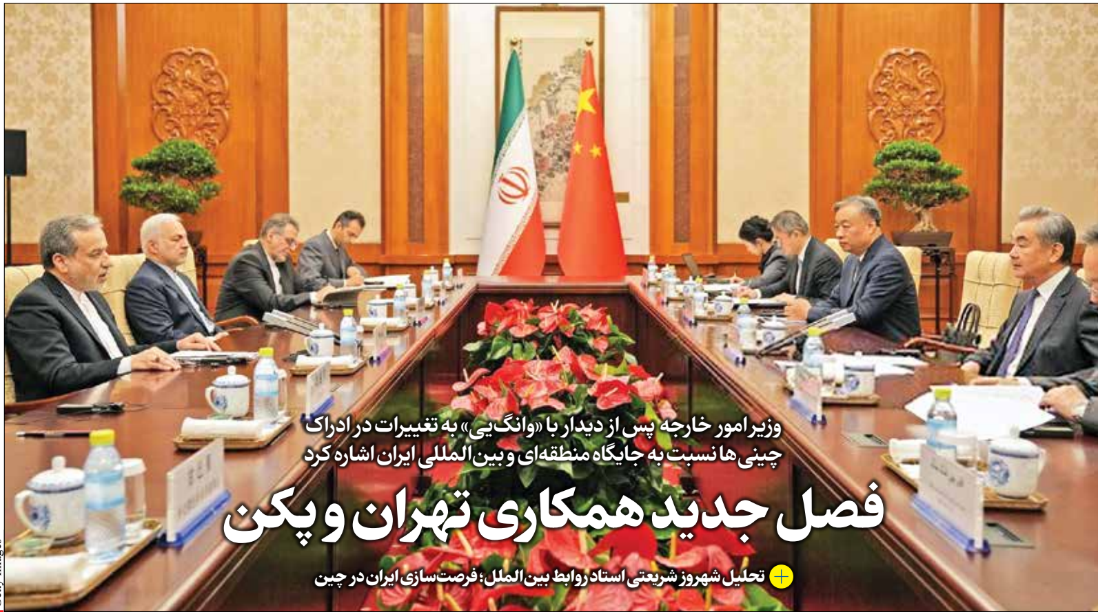
وزیر امور خارجه پس از دیدار با «وانگ‌یی» به تغییرات در ادراک چینی‌ها نسبت به جایگاه منطقه‌ای و بین‌المللی ایران اشاره کرد