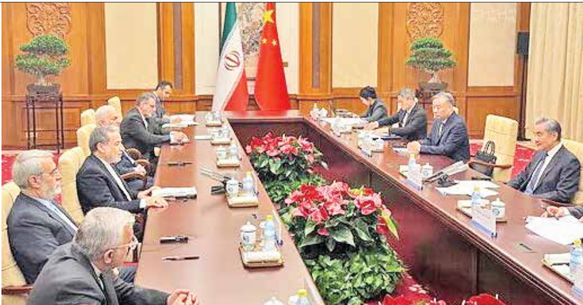
«ایران» در گفت و گو با استاد روابط بین الملل اهداف سفر عراقچی به چین را وا کاوی می کند