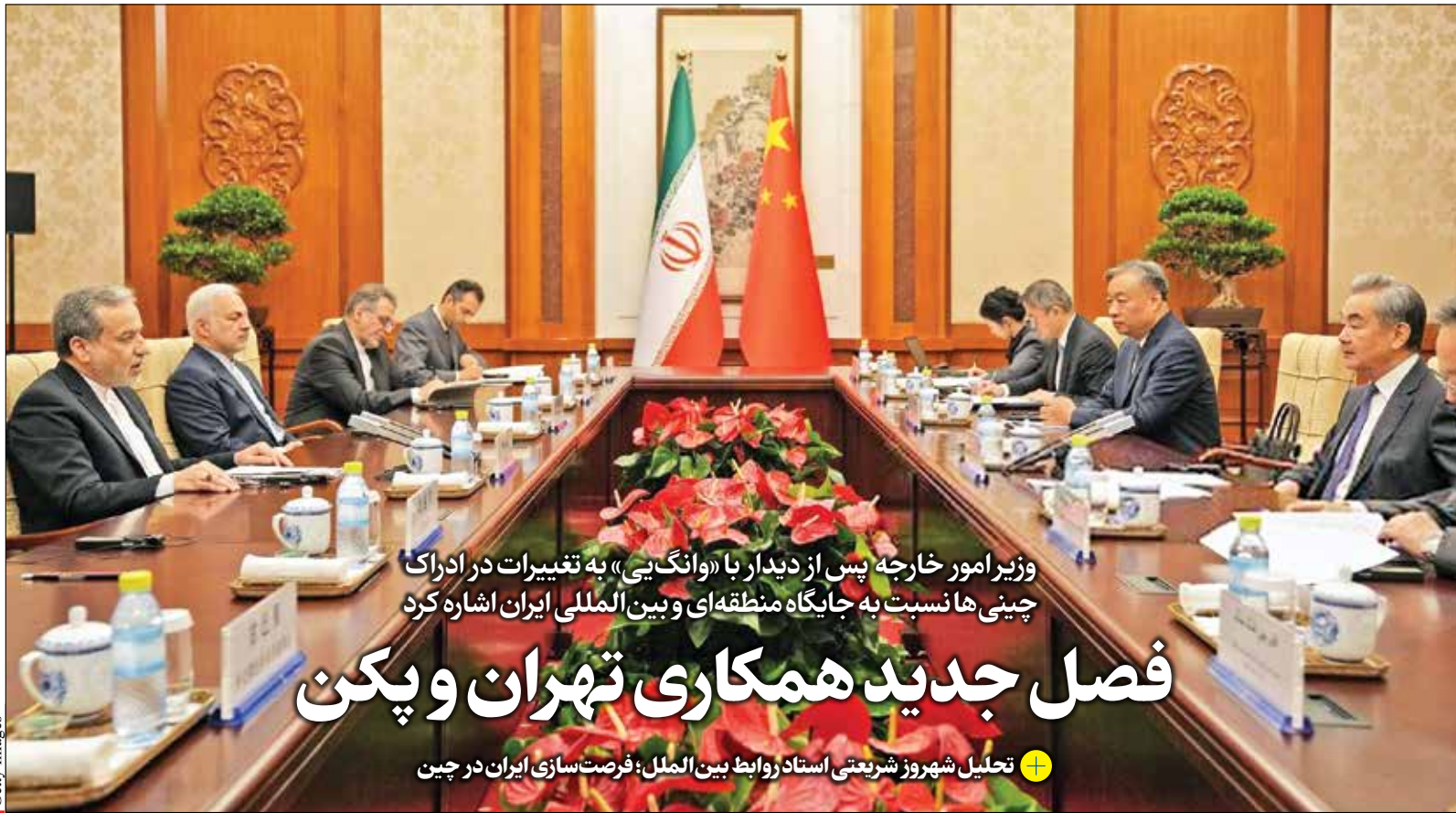
وزیر امور خارجه پس از دیدار با «وانگ‌یی» به تغییرات در ادراک چینی‌ها نسبت به جایگاه منطقه‌ای و بین‌المللی ایران اشاره کرد