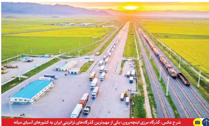
شرح عکس: گذرگاه مرزی اینچه برون؛ یکی از مهم ترین گذرگاه های ترانزیتی ایران به کشورهای آسیای میانه

بندار شمالی و گذرگاه مرزی اینچه برون در نقش پشتیبان مسیرهای جنوبی قرار گرفتند