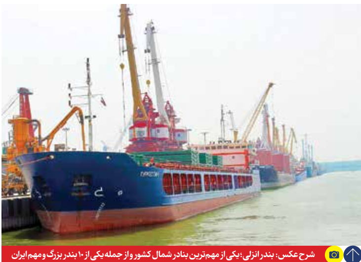
شرح عکس: بندار انزلی؛ یکی از مهم ترین بندار شمال کشور و از جمله یکی از ۱۰ بندر بزرگ و مهم ایران