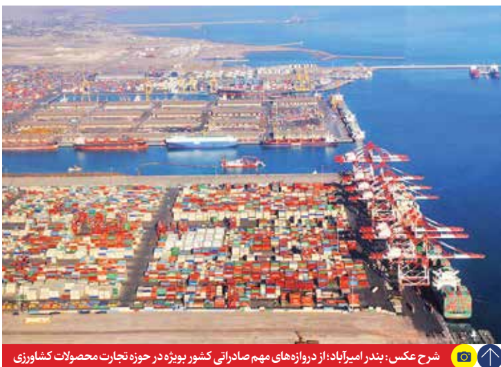
شرح عکس: بندار امیرآباد؛ از دروازه های مهم صادراتی کشور بویژه در حوزه تجارت محصولات کشاورزی