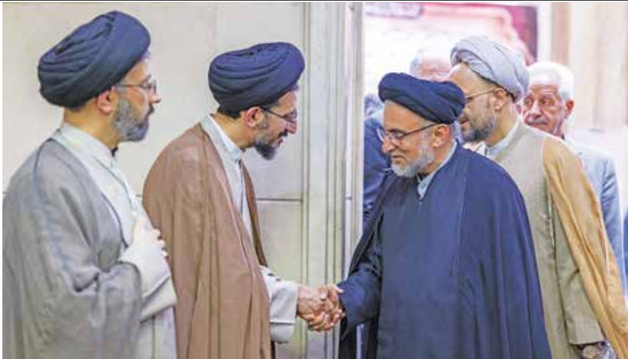
محسن اسماعیلی، معاون اول رئیس‌جمهوری ایران

با حضور معاون اول رئیس‌جمهور و تعدادی از مقامات کشوری برگزار شد