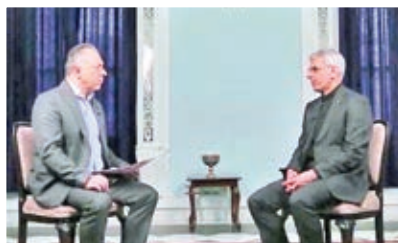
هشدار تهران نسبت به راهبرد امنیت عاریتی