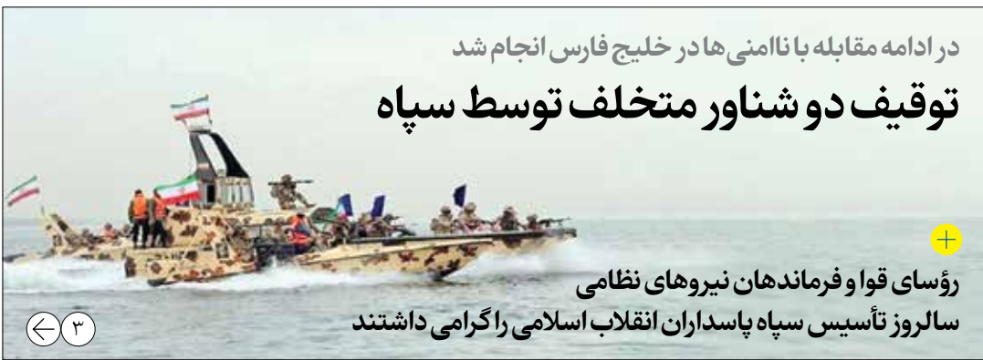
در ادامه مقابله با ناامنی هادر خلیج فارس انجام شد