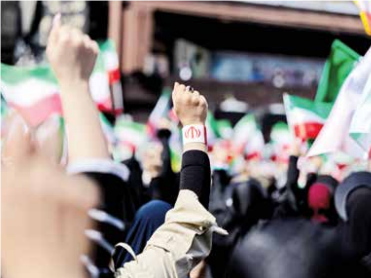
یک منظره از جشن ملی در تهران

برخلاف پادشاهان پیشین، رهبران جمهوری اسلامی ایران در تربیت و جامعه‌سازی با ساخت روحيات و تکرراتی بر مبنای مقاومت، وحدت، تلاش، جهاد، ایستادگی و دفاع، مهارت‌های متنوع و نوینی داشتند که این موارد، پیوندی ارگانیک و ناگسستنی میان مردم و حکومت تازه تأسیس ایجاد کرد. نمود آن را می‌توان در مبارزه با تجزیه‌طلبان در همان ماه‌های اولین انقلاب و دفاع مقدس ۸ساله دید. تهاجم رژیم بعث عراق با هدف تجزیه و شکست دادن انقلاب آغاز شد. آن زمان ساختار نظامی و امنیتی ایران آنچنان زنده و کارآموده نبود. اما در طرف مقابل ارتش رژیم بعث تا بن دندان مسلح، مجهز و مورد حمایت دولت‌های قدرتمند نظامی غربی