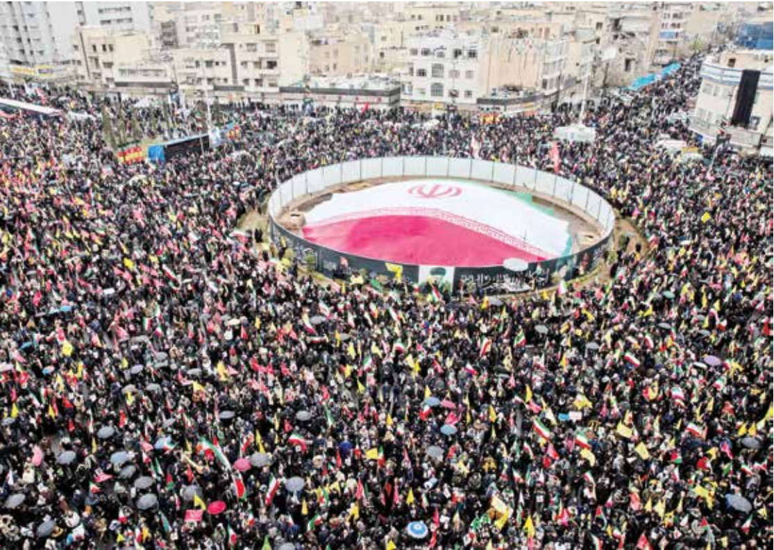
یک منظره از جشن ملی در تهران

در طول تاریخ، جامعه ایرانی شاهد بوده که با حمله خارجی، هرچند تغییرات سیاسی ایجاد شده، اما در مجموع وضعیت جامعه بدتر شده، استقلال‌ش را از دست داده و هزینه‌های بسیار بیشتری پرداخت کرده است. این آگاهی تاریخی به اکثریت جامعه ایرانی این حس را می‌داد که چالش را با حمله خارجی نمی‌شود حل کرد. حتی منتقدان خیلی سرسخت نظام سیاسی هم گفتند: انتقادات ما سرچایش، اعتراضات ما سرچایش، اما فعلاً باید از وطن و ایران دفاع کرد. در این شرایط، ایده «وطن» یا به تعبیر بهتر، ایده «ایران» فراگیرترین ایده بود. مردم به واسطه باور به این ایده بود که در همه طیف‌های مختلف گروه‌های متنوع، پای ایران ایستادند و دل‌داده و دلنگران با همه توان برای دفاع از ایران وارد میدان شدند. این ایده در این موقعیت بحرانی نشان داد که جامعه ایرانی را چگونه می‌شود تاب‌آور کرد، چگونه می‌شود مقاومت‌سازی کرد، چگونه می‌شود سرمایه اجتماعی را افزایش داد، این‌ها دقیقاً همان مکانیسم‌هایی است که جامعه در این شرایط نشان داد. مهم‌ترین مؤلفه این بود که فراگیرترین مفهوم - یعنی مفهوم «ایران» - که همه اقلیت‌ها، جناح‌های سیاسی و سبک‌های زندگی متفاوت ذیل آن می‌توانستند جمع شوند، به وسط میدان آمد. این انسجام فراگیر ذیل ایده ایران امکان‌پذیر بود. آنچه سبب پیوند گروه‌ها و بخش‌های مختلف جامعه شد، همین ایده و آرمان بود. جالب اینکه در همین ایام جنگ و بحران، میزان خروجی‌های ما از مرزها بسیار کمتر از میزان ورودی‌ها بود؛ یعنی برخی از آدم‌ها که منتقد نظام سیاسی بودند، برگشتند تا از وطن دفاع کنند.