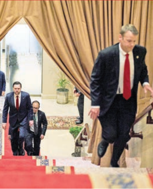
ایزت‌الحق چوهدری، نخست‌وزیر پاکستان، در جریان دیدار با دونالد ترامپ، رئیس‌جمهور آمریکا، در اسلام‌آباد، پاکستان.

من فکرمی‌کنم این جنگ تأثیر منفی خواهد داشت و بخش بزرگی از آن این است که مردم ایالات متحده متوجه خواهند شد که ایالات متحده در این جنگ شکست خورده به این یک فاجعه برای کشور بوده است و به دلیل شواهد روشن، اسرائیل ما را به این جنگ کشانده است. بنیامین نتانیاهو نخست وزیر اسرائیل، نقش