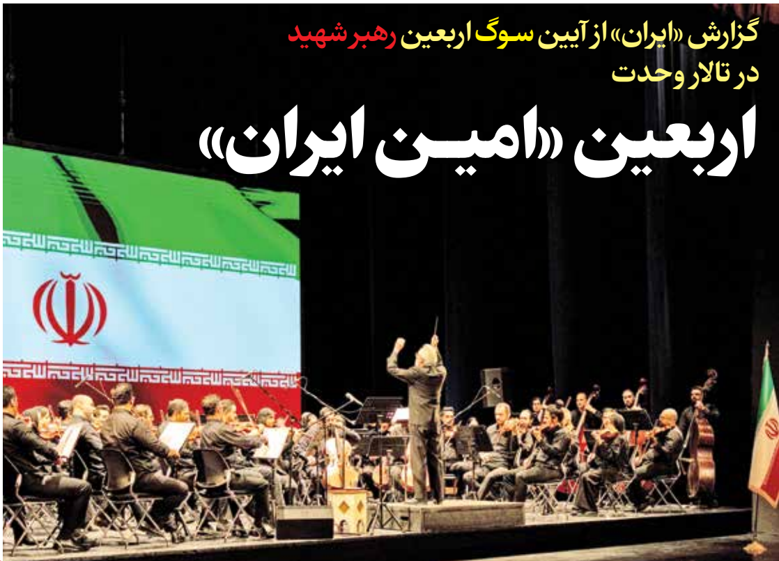
ایران در تالار وحدت

ایشان» برگزار شود. «عسگریور به دیدارهای رهبر شهید با هنرمندان اشاره کرد و گفت: «امیدوارم دیدارهای فردی ضبط شده ایشان با هنرمندان باز تعریف شود چرا که هر یک از این دیدارها یک کلاس درس است.» او در ادامه به دیدگاه رهبر شهید به حوزه فرهنگ و هنر اشاره کرد و افزود: «اهالی فرهنگ و هنر شهادت می‌دهند که ایشان در حوزه سیاسی، اجتماعی و نظامی مجتهد بودند و در حوزه فرهنگ و هنر نیز حرف‌های نو داشتند.»