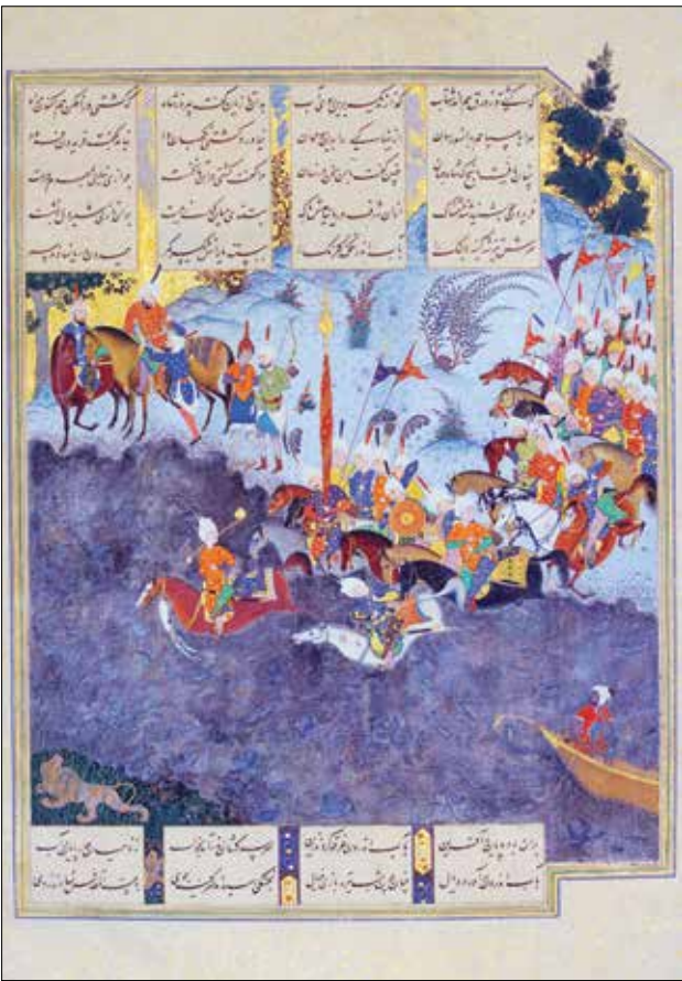
برگی از شاهنامه نسخه شاه طهماسبی که در آن به‌با خاستن فریدون در برابر ضحاک و عبور او از دجله مصور شده است

• نگاه معناگرا و اصالت‌گرای ایرانی بر مبنای چنین دیدگاهی از فرهنگ ما مترادف شخصیت و شخصیت فراتر از فرد و منعکس‌کننده منش ملی است، در شرایط و موقعیت کنونی جامعه ایران، مسأله و پرسش بنیادین این است که چه احتمالی از تاب‌آوری ایرانی در منسح ملی ایرانیان در برابر جنگ متجاوزانه آمریکایی-صهیونیستی