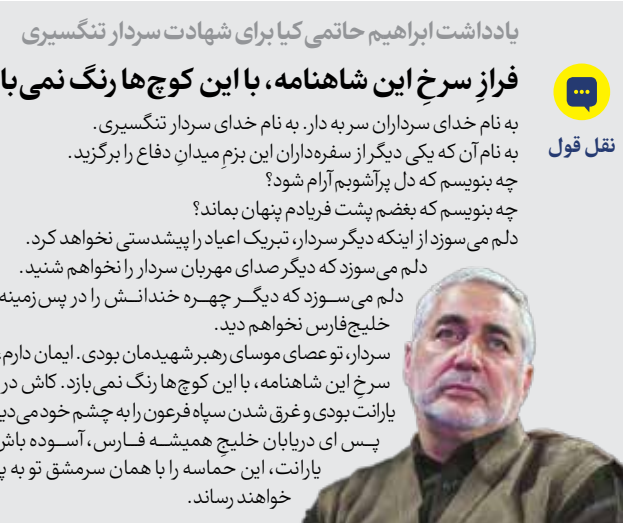
یادداشت ابراهیم حاتم‌ی کیا برای شهادت سردار تنگسیری