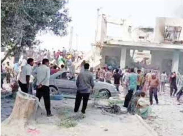
حمله موشکی به مدرسه شجره طیبه میناب

مخاصات مسلحانه به شمار می‌رود. در نتیجه، به مایهت این رویداد و تهدد جامعه بین‌المللی به مبارزه با مصونیت از مجازات در قبال جنایات بین‌المللی، امضاکنندگان این دادخواست از مراجع ذی‌صلاح بین‌المللی و ملی درخواست می‌کنند که تحقیقی فوری، مستقل، بی‌طرفانه و مؤثر درباره این حمله آغاز کرده و مسئولان آن را