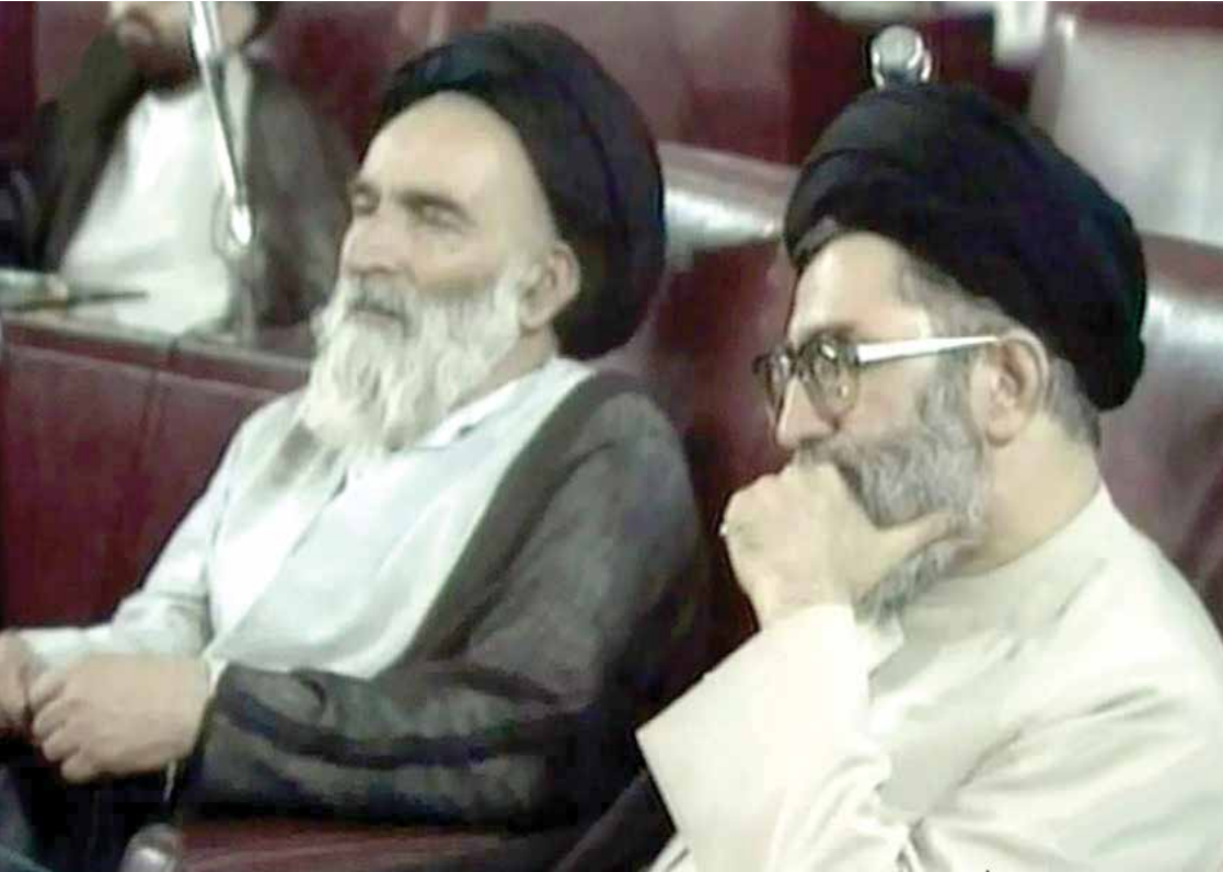
مجلس خبرگان رهبری در ۱۴ خرداد۱۳۶۸ / رهبر شهید انقلاب سیدمهدی روحانی

سمت مدل خاصی از رهبری، مثلاً رهبری فرد یا رهبری شورایی سوق می‌داد. در اجلاسیه خرداد ۶۸، دیدگاه سوم پیروز شد. دیدگاه سوم، غایت هنرمندی خبرگان در حل معادله پیش‌گفته بود؛ بهترین پاسخ برای تطبیق ضابطه با وضعیت. دیدگاه سوم، بیانگر امکان هم‌طلبیت آن دسته از فقهاییی بود که در عین بهره‌مندی از فقه اجتهادی، زمان‌شناس بودند، در تجربه ۱۰ ساله جمهوری اسلامی، مدیرانی آبدیده و دنیادیده شده بودند، خط امام را می‌شناختند و در یک کلمه، فقهاییی سیاستمدار بودند. با تدبیر خبرگان، یکی از مصادیق واضح این طایفه از فقها، یعنی آیت‌الله سیدعلی خامنه‌ای به‌عنوان دومین رهبر انقلاب و جمهوری اسلامی برگزیده شد.