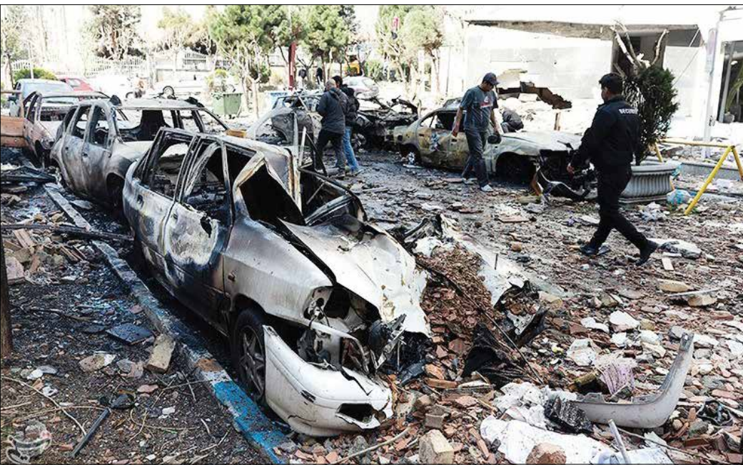
تصویری از حملات هوایی آمریکا و رژیم صهیونیستی به شهرک های مسکونی در تهران

کاملاً مسکونی در شرق پایتخت نیز هدف حمله قرار گرفت؛ بنا بر گزارش رسانه ها، شمار شهدا و مجروحان در این حمله بالا اعلام شده و عملیات امدادرسانی همچنان ادامه دارد. گرچه آمار تفکیکی استان ها منتشر نشده، اما طبق اعلام رسمی بنیاد شهید و امور ایثارگران، تا لحظه تنظیم این گزارش، بیش از ۱۰۴۵ نفر از هموطنانمان در پی حملات تجاوزکارانه آمریکا و اسرائیل به شهادت رسیده اند.