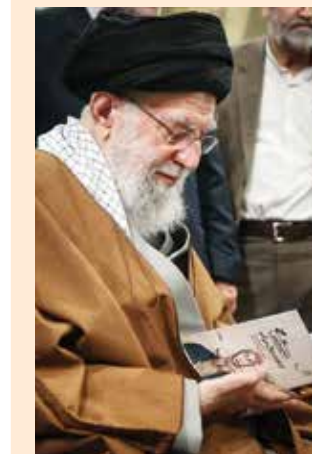
است. او برای من تنها یک رهبر نبود، بلکه بخشی از وجود بود. هنوز هم آن لبخند و آن چهره نورانی در برابر چشم‌مانم است و تا درم مرگ فراموشش نخواهم کرد. ای پدر مهربانم، ای رهبرم! یادت همیشه بر سجاده قلبم زنده خواهد ماند.

بزرگترین نقطه عطف زندگی من زمانی بود که برای مقطع دکتری در رشته مطالعات اسلامی در دانشگاه تهران پذیرفته شدم.