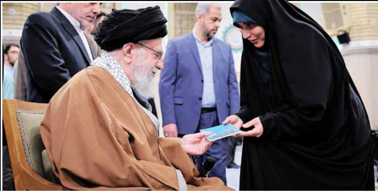
آخرین دیدار شاعران و اهالی فرهنگ و ادب فارسی با رهبر معظم انقلاب/ ۲۵ اسفند ۱۴۰۳