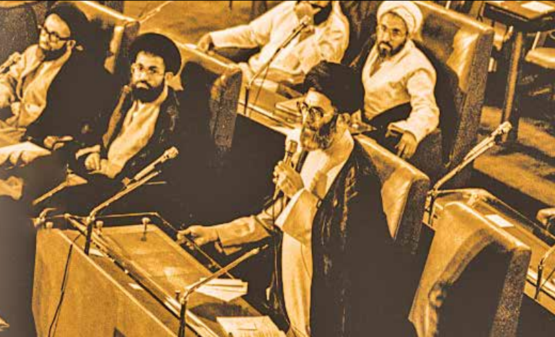
جلسهٔ مجلس خبرگان رهبری برای انتخاب رهبر در نیمهٔ خرداد سال ۱۳۶۸