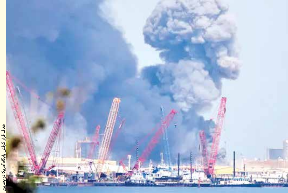
هدف قرار گرفتن پایگاه آمریکا در بحرین

یک‌جانبه‌ای، به سوی اتحاد‌های راهبردی با تهران متمایل خواهند شد. واکنش‌های سریع و یکپارچه سیاسی و نظامی در ساعات اولیه پس از حادثه، گواهی بر این امر است. آمریکا ناخواسته به مهم‌ترین متحدساز برای محور مقاومت تبدیل شده است. در یک کلام، اقدام