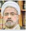
مرتضی جوادی‌آملی رئیس بنیاد بین‌المللی علوم وحیانی اسراء و استاد حوزه علمیه قم

مَنْ الْفُؤُونِيْنَ رَجَالَ صَدَقُوا مَا نَعُدُّوْا اَللّٰهَ عَلَيْهِ فَمِنْهُمْ مَنْ قَضَىٰ نَحْبَهُ وَمِنْهُمْ مَنْ يَنْتَظِرُ وَمَا بَدَّلُوا تَبْدِيْلًا شهادت افتخار آفرین رهبر معظم انقلاب حضرت آیت‌الله خامنه‌ای (قدس سره) به حق ثلمه‌ای جبران ناپذیر به اسلام و امت اسلامی به شمار می‌آید؛ رهبری که قریب چهل سال، تمام سعی و تلاش خود را در جهت اعتلای کشور و نظام اسلامی مصروف داشته و لحظه‌ای در این مسیر فکری و فرهنگی تردید و درنگ به خود نداده و همواره بر این باور بوده که تنها راه فتح و ظفر، مقاومت، ایستادگی و پایداری در راه دین و ارزش‌های آن است. بحق می‌توان این شخصیت کم‌نظیر را که تمام مدت عمر پرتیتر خویش را در مسیر اجتهاد و فراگیری علوم الهی و نیز نشر و گسترش آن و نیز پایداری و مقاومت در جهت تحقق آن داشته و در این راه بی‌وقفه و خستگی‌ناپذیر جهاد نموده و تا آخرین نفس بر این راه پرخطر اصرار داشته، از ماندگاران عرصه دین، علم و سیاست برشمرد. او با اقتدا به امام خمینی (رحمة‌الله‌علیه) یا در ربک انقلاب نهاد و همه سعی خود را در برپا داشتن مکتب آن فقیه مجاهد و حکیم روشن‌بین صرف نموده تا مسیری که مؤسس و معمار این مکتب انقلابی تأسیس نمودند، همچنان ادامه یابد. ایشان در این رابطه، یک امت را با خود همراه کرده و با شیوه عشق و محبت، راهبری این امت را به دست گرفتند. اداره و تدبیر کشور بزرگ،