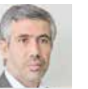
رضا اسماعیلی شاعر و منتقد ادبی