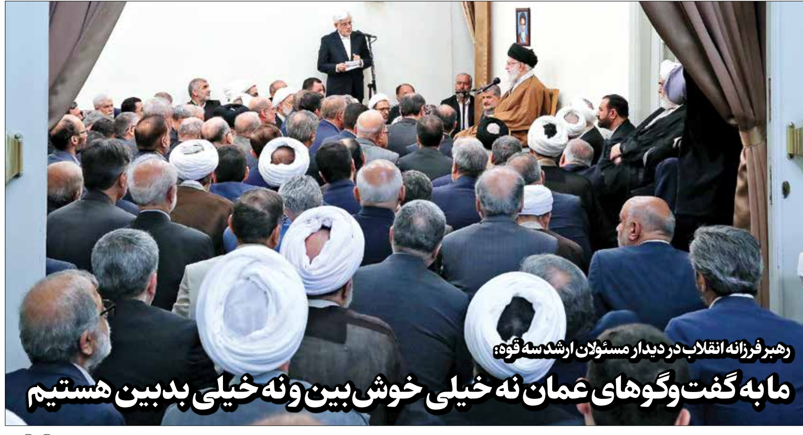
رهبر فرزانه انقلاب در دیدار مسئولان ارشد سه قوه: مابه‌گفت‌وگوهای عمان نه خیلی خوش بین و نه خیلی بدبین هستیم