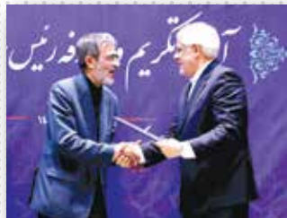
مراسم تکریم و معارفه رؤسای پیشین و جدید جهاد دانشگاهی