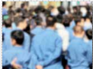
وزارت آموزش و پرورش مستول پیگیری شد

رئیس کمیسیون ویژه آب شورای شهر اصفهان: نصف جهان دنبال صنایع آب‌پرنیود مدیرعامل آب منطقه‌ای یزد: قطره‌ای از آب انتقال کوه‌رنگ وارد بخش صنعت و کشاورزی یزد نمی‌شود