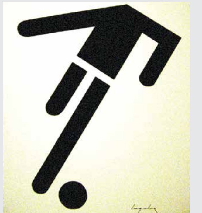
طراح: لوکا لاگاتور