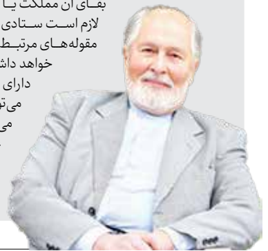
به بهانه زادروز سید حسین نصر فیلسوف

دولت‌ها همواره به اینکه ریاضیات برای مهندسی [و مهندسی برای مملکت] مهم است توجه دارند ولی متوجه این نیستند که به عنوان مثال تاریخ یک مملکت یا فرهنگ آن یا فلسفه، چه اندازه برای بقای آن مملکت یا حفظ زلی می‌آن اهمیت دارد. بنابراین لازم است ستادی ویژه وجود داشته باشد تا به طور جدی به مقوله‌های مرتبط با علوم انسانی توجه کند و این بستگی خواهد داشت به درایت و دوراندیشی افرادی که دارای توانایی سیاسی- اقتصادی هستند و می‌توانند این ثروت جدیدی را که وارد ایران می‌شود برای عزت واقعی مملکت به صورت عاقلانه تقسیم کنند.