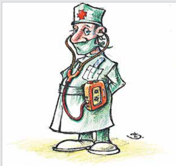
طراح: لیویو استیلا