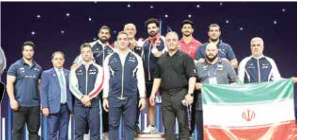
اولین نایب قهرمانی تیم ملی وزنه برداری ایران در جهان. تیم ما پس از ۷۵ سال، برای اولین بار در مسابقات جهانی منامه بحرین، پس از چین به مقام دوم رسید.