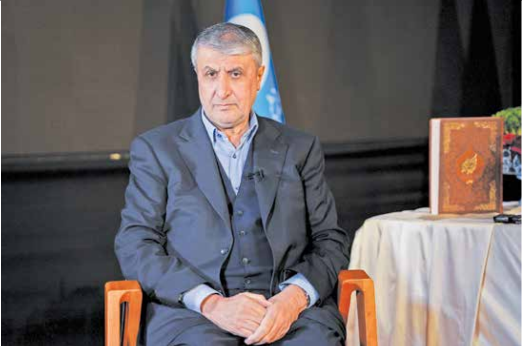
محمد اسلامی، رئیس سازمان انرژی اتمی

پیش نویس قطعنامه را منتشر کردند و ارزشی برای مدیرکل قائل نشدند که با آنها هماهنگ کرده و به ایران آمده بود. آنها خیلی زود هنگام و بدون اینکه نتیجه توافقات آقای «گروسی» با ایران را دریافت کنند، در حقیقت او را به گونه ای سنگ روی یخ کردند. همان موقع هم آقای «گروسی» با پیام هایی که از طریق معاونش و معاون ما ردوبدل شد، گفت من خیلی برای این اتفاق متأسفم؛ یعنی خود مدیرکل نه از سمت ما بلکه از سمت طرف مقابل ابراز تأسف کرده بود.» به گفته رئیس سازمان انرژی اتمی این روند تداوم پیدا کرد تا باز شرایط اخیر منطقه پیش آمد. نتیجه انتخابات آمریکا مشخص شد و با روی کار آمدن آقای ترامپ، طبیعی بود که آن خطمشی ای که دولت قبلی آمریکا دنبال می کرد، دنبال نشود و فضا وارد یک حالت توقف و رکود شد به طور بدیهی هم این اتفاق می افتاد.»