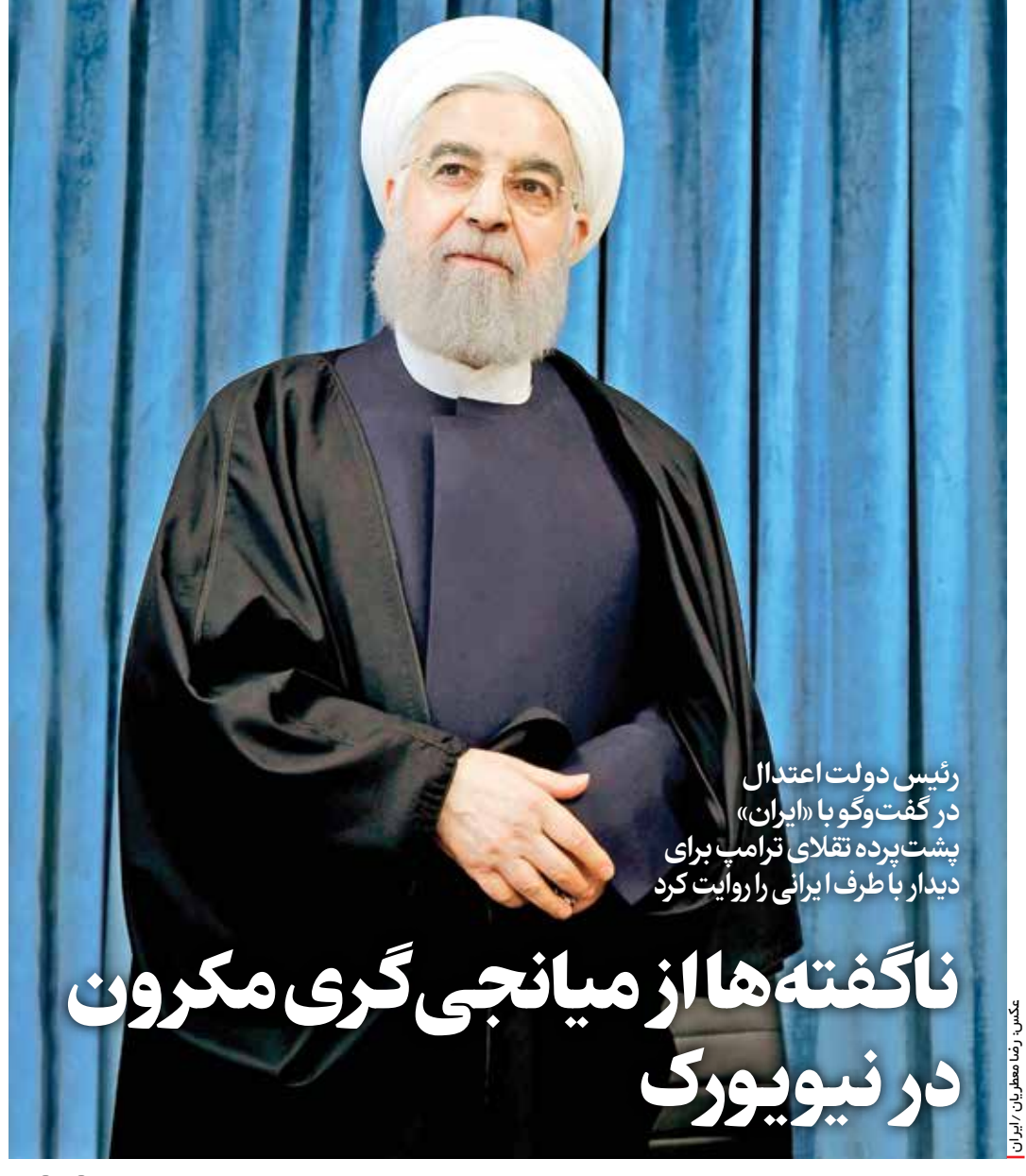
رئیس دولت اعتدال در گفت‌وگو با «ایران» پشت‌پرده تقلاي ترامپ برای دیدار با طبرف ایرانی را روایت کرد ناگفته‌ها از میانجی‌گری مکرون در نیویورک

آنچه ایران در ۱۴۰۳ به چشم دید تلخ و شیرین‌های سیاسی، اجتماعی، فناوری، ورزشی و محیط‌زیستی