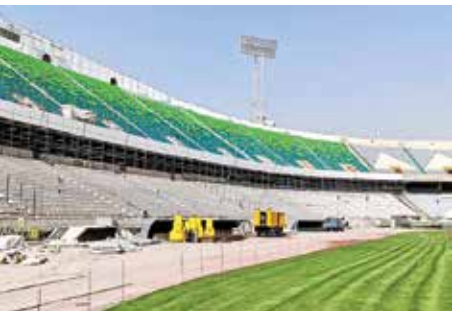
ورزشگاه آزادی تهران ۳۱ خرداد ۱۴۰۳ بعد از میزبانی بازی فینال جام حذفی برای بازسازی سکوها و مرمت چمن تعطیل شد و هفت ماه بعد برای بازی نمادین بین تیم منتخب ۱۹۹۸ و منتخب سرخابی‌ها بازگشایی شد.