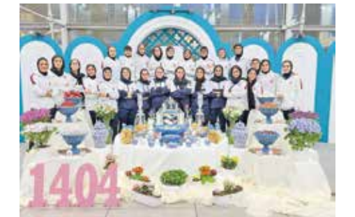
ملکه‌های شگفتی‌ساز تیم فوتبال خانوم تیم اولین تیم فوتبال زنان ایران در عرصه باشگاهی و ملی است که در رویدادی آسیایی جزو ۸ تیم برتر شد. این تیم فروردین ماه ۱۴۰۴ در شهر اینچون به مصاف هیوندای می‌رود.