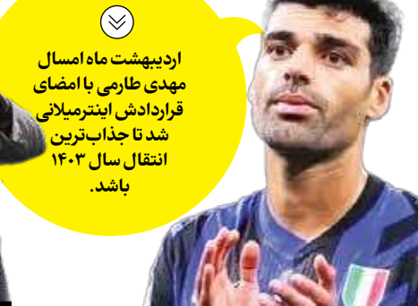
اردیبهشت ماه امسال مهدی طارمی با امضای قراردادش اینترنشنالی شد تا جذاب‌ترین انتقال سال ۱۴۰۳ باشد.