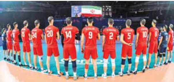
از دست رفتن سهمیه المپیک و البیال ایران با ناکامی مطلق در لیگ ملت‌های ۲۰۲۴ مردان و اخراج پاتر سرمربی برزیلی تیم.