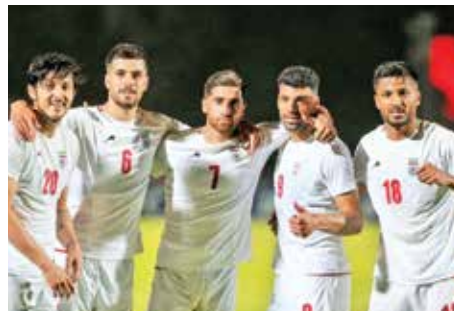
تیم ملی فوتبال ایران در آستانه صعود به جام جهانی ۲۰۲۶ قرار گرفت. تیم ملی فوتبال کشورمان برای حضور در رقابت‌های جام جهانی ۲۰۲۶ شانس بالایی دارد. تیم ملی ۱۶ امتیاز با ۴ امتیاز از دو بازی مقابل امارات و ازبکستان جشن صعود می‌گیرد.