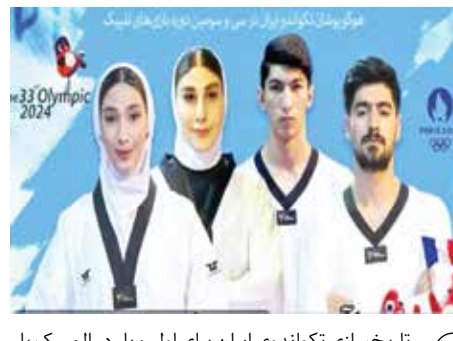
تاریخ‌سازی تکواندو ایران برای اولین بار در المپیک با یک طلا، یک نقره و دو برنز در چهار وزن.