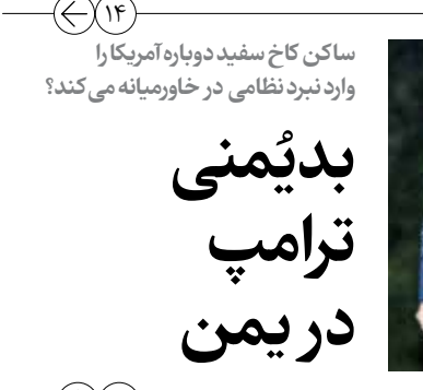
ساکن کاخ سفید دوباره آمریکا را وارد نبرد نظامی در خاورمیانه می‌کند؟ بدیمنی ترامپ در یمین