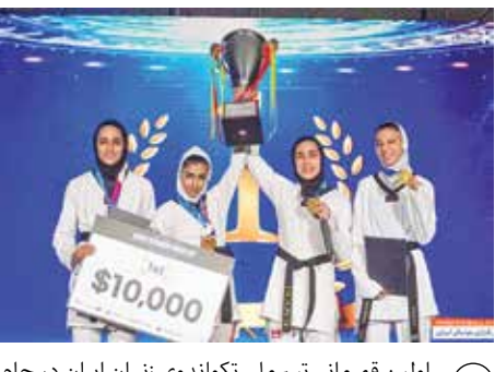
اولین قهرمانی تیم ملی تکواندو زنان ایران در جام جهانی کره جنوبی.