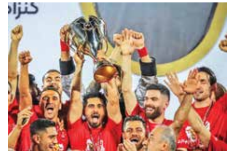
قهرمانی پرسپولیس در بیست و سومین دوره لیگ برتر از مهم‌ترین اتفاقات فوتبال ایران بود.