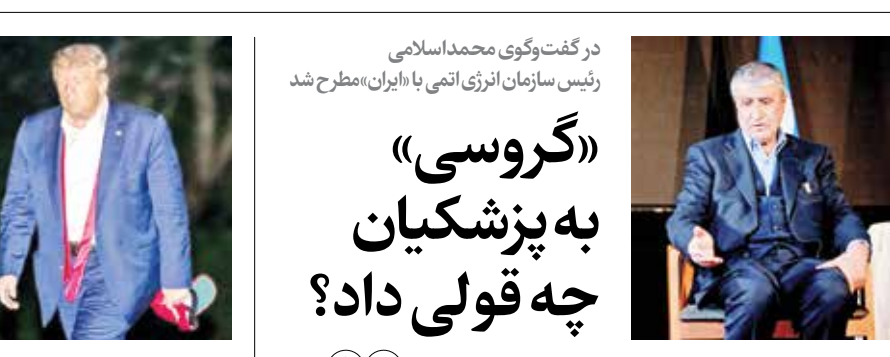
در گفت‌وگو محمداسلامی رئیس سازمان انرژی اتمی با «ایران» مطرح شد «گروسی» به پزشکین چه قولی داد؟