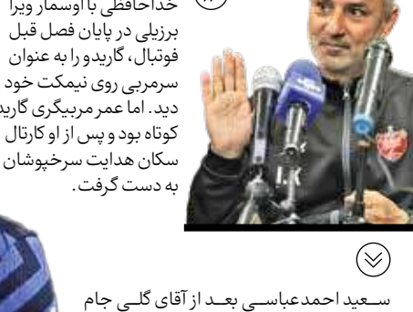
پرسپولیس پس از خداحافظی با اوسمار ویرا برزیلی در پایان فصل قبل فوتبال، گاریدو را به عنوان سرمربی روی نیمکت خود دید. اما عمر مربیگری گاریدو کوتاه بود و پس از او کارنال سکان هدایت سرخپوشان را به دست گرفت.