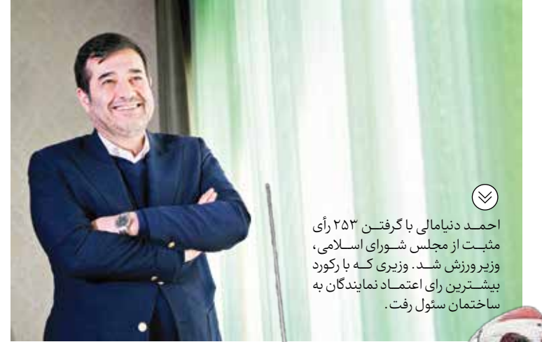
احمد دنیاامالی با گرفتن ۲۵۳ رأی مثبت از مجلس شورای اسلامی، وزیر ورزش شد. وزیری که با رکورد بیشترین رأی اعتماد نمایندگان به ساختمان ستول رفت.