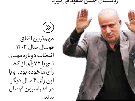
مهم‌ترین اتفاق فوتبال سال ۱۴۰۳، انتخاب دوباره مهدی تاج با ۷۲ رأی از ۸۶ رأی مأخوذه بود. او با این رأی ۴ سال دیگر در فدراسیون فوتبال ماند.