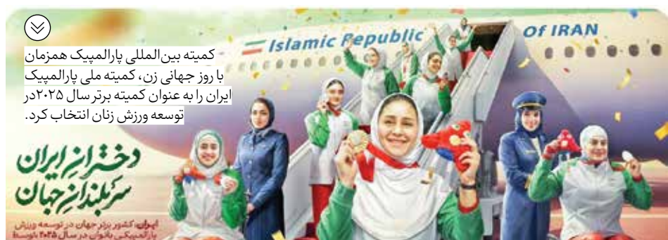
کمیته بین‌المللی پارالمپیک همزمان با روز جهانی زن، کمیته ملی پارالمپیک ایران را به عنوان کمیته برتر سال ۲۰۲۵ در توسعه ورزش زنان انتخاب کرد.