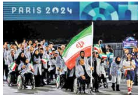
کاروان فرزندان ایران پرورنده بازی‌های پارالمپیک ۲۰۲۴ پاریس را با ۲۵ مدال و چهاردهمی ایران بستند.