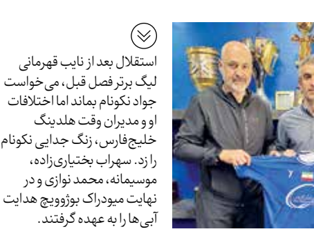
استقلال بعد از نایب قهرمانی لیگ برتر فصل قبل، می‌خواست جواد نکونام بماند اما اختلافات او و مدیران وقت هلدینگ خلیج فارس، زنگ جدایی نکونام را زد. سهراب بختیاری‌زاده، موسی‌مهر، محمد نوازی و در نهایت میودراک پوزوویچ هدایت آبی‌ها را به عهده گرفتند.