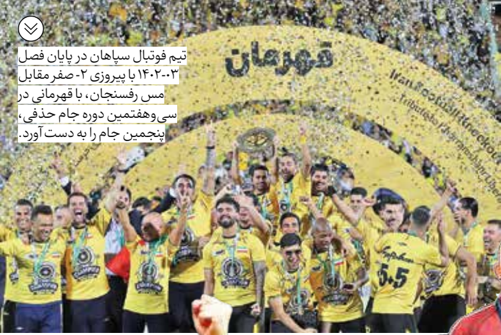
تیم فوتبال سپاهان در پایان فصل ۱۴۰۲-۰۳ با پیروزی ۲-۰ صفر مقابل مس رفسنجان، با قهرمانی در سی‌وهفتمین دوره جام حذفی، پنجمین جام را به دست آورد.

۱۴۰۳ سالی پرفراز و نشیب در ورزش ایران بود. اشک‌ها و لبخندهای درهم تنیده و تلخی‌ها و شیرینی‌های سریالی که شکل برجسته و فشرده آن در المپیک پاریس دیده شد. کاروانی که برای مبارزه‌ای جانانه رفت و جنگید؛ اما فرجام بعضی نبردها، مدال نبود. سال به پایان رسید؛ اما سال ۱۴۰۴ تقویم شلوغی برای ورزش ایران دارد. جدا از رقابت‌های قهرمانی آسیا و جهانی که در تقویم همه رشته‌ها هست، کاروان ورزشی ایران باید در بازی‌های کشورهای اسلامی ریاض و بازی‌های آسیایی جوانان بحرین حاضر شود و طبق برنامه وزیر باید بهتر از دوره قبل باشیم. در دوره قبل بازی‌های کشورهای اسلامی (به میزبانی قونیه) ۳۹ طلا، ۴۴ نقره و ۵۰ برنز گرفتیم و سوم شدیم؛ اما با تاکید احمد دنیاامالی وزیر ورزش باید در ریاض اول شویم؛ این یعنی سنگین شدن بار مسئولیت ورزش کشور در رویدادی که ورزشکاران ایران در آن برای بازی‌های آسیایی ۲۰۲۶ ناگویا محک می‌خورند.