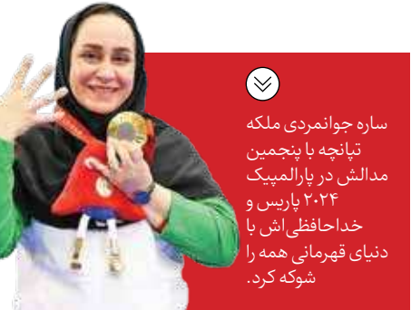
ساره جوانمردی ملکه تانچه با پنجمین مدالش در پارالمپیک ۲۰۲۴ پاریس و خداحافظی اش با دنیای قهرمانی همه را شوکه کرد.