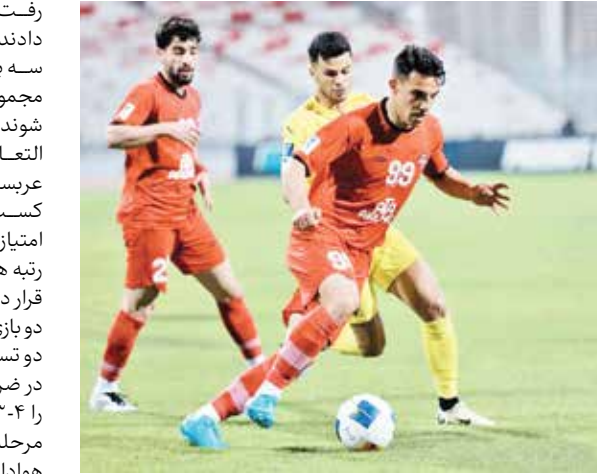
نصرتی: تراکتور توانایی برد مقابل التعاون را دارد