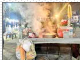
زیست شبانه و تجربه گذر خوراکی در میدان شهرداری رشت