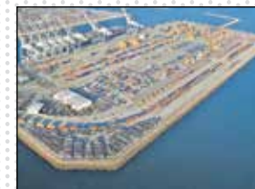
تحلیل دانشیار دانشکده روابط بین‌الملل هندی در تارنمای دیپلمات: