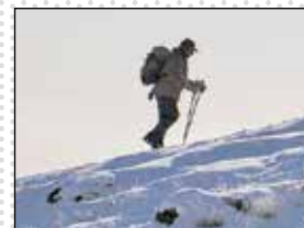
چرا کوهنوردان با حجم بالای سوانح دست به گریبانند؟

هر دو هفته یک کوهنورد از کوهستان بازمی‌گردد