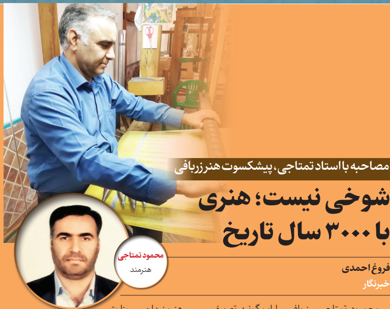
مصاحبه با استاد تمناجی، پیشکسوت هنر زربافی