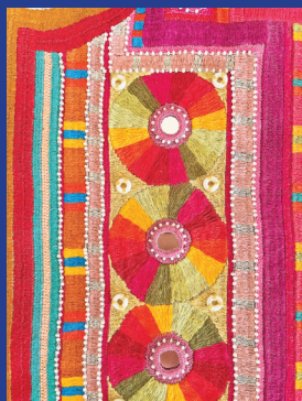
« هنرمند: زینب سلحشور « رشته: رودوزی‌های سنتی « شهر: کرج