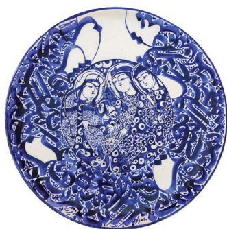
« هنرمند: بهروز زیندشتی « رشته: کاشی سنتی، سفال و سرامیک « شهر: تهران