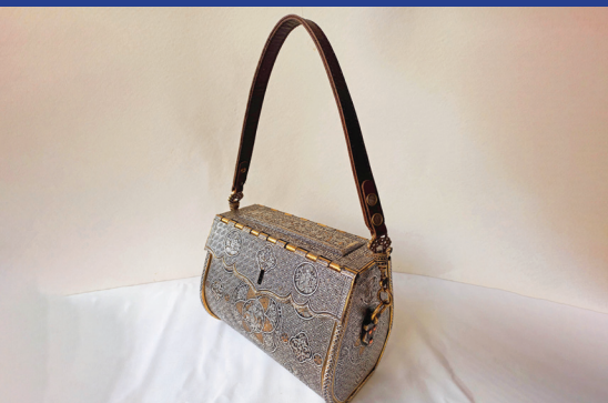
هنرمند: صادق کیانی پیکانی رشته: صنایع دستی فلزی شهر: اصفهان