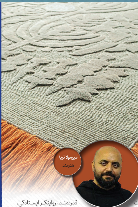
میرمولا ثریا هنرمند

اثری که با الهام از گیاهان دریایی طراحی شد