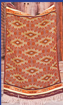
هنرمند: مینا غلام اکبر رشته: بافته‌های داری و غیرداری شهر: تبریز